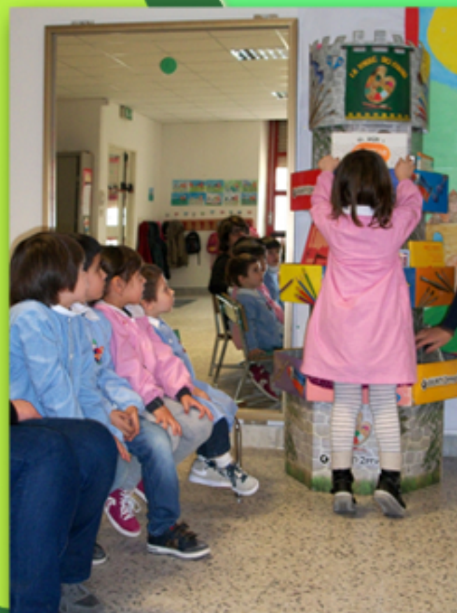
Gli ughi e la maglia nuova