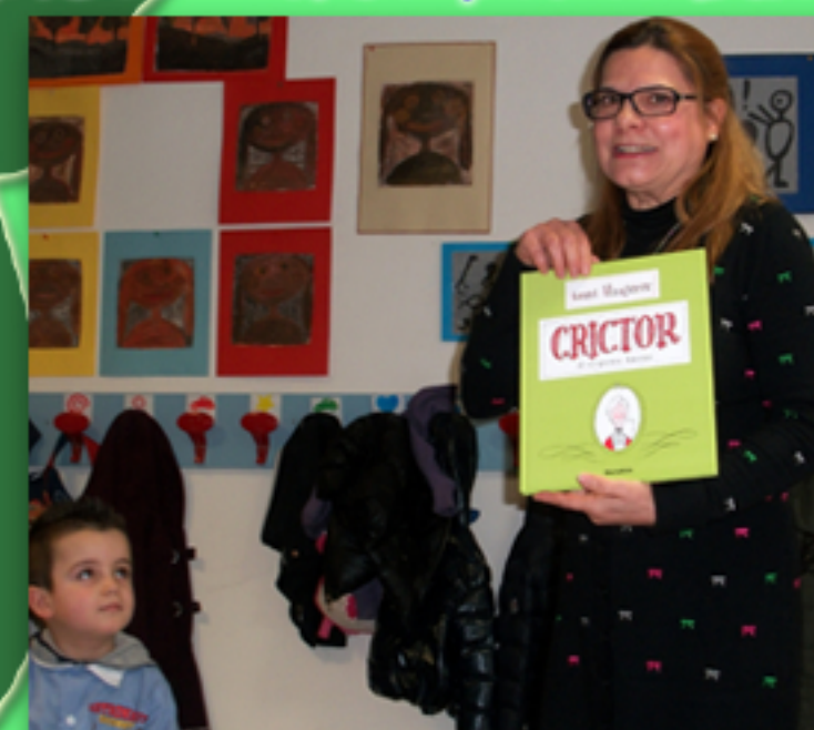
Crictor : il serpente buono