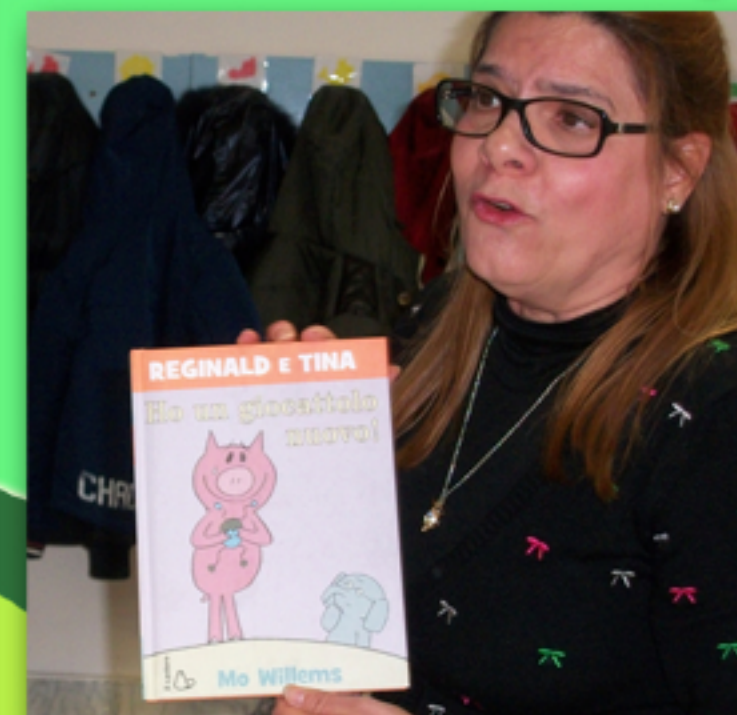
Ho un giocattolo nuovo!