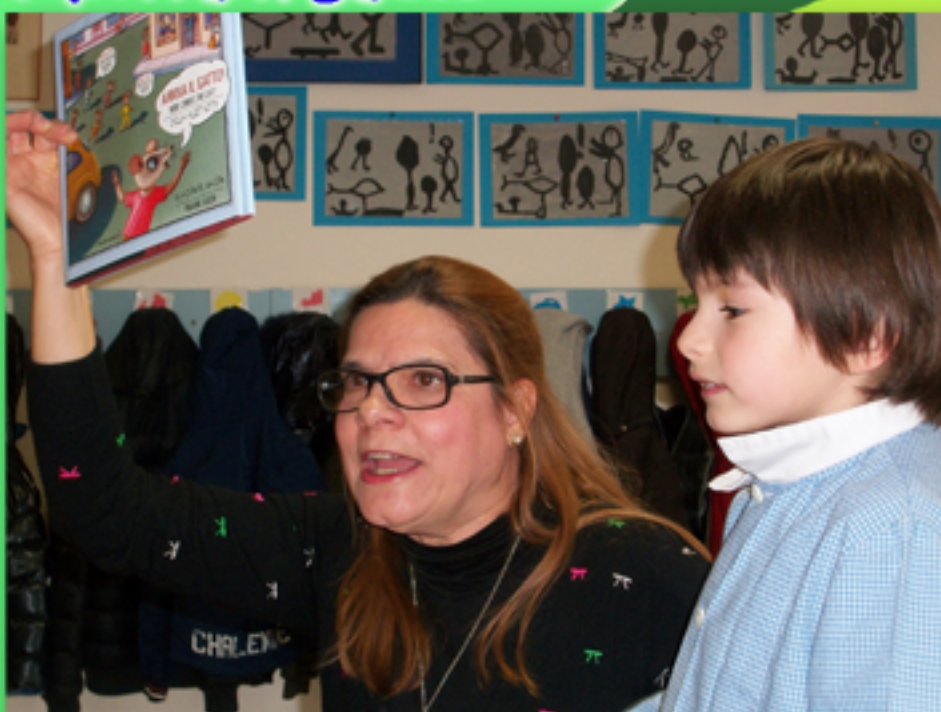
Arriva il gatto