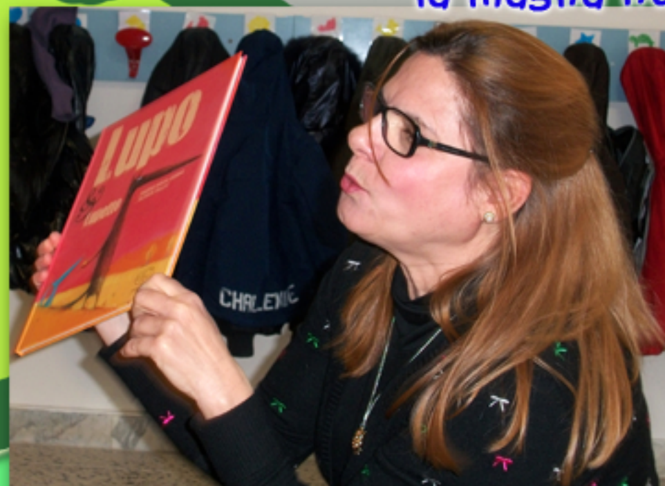
Lupo & Lupetto