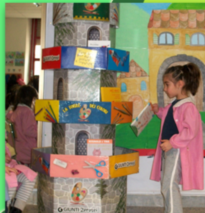
Camillo è il più forte di tutti